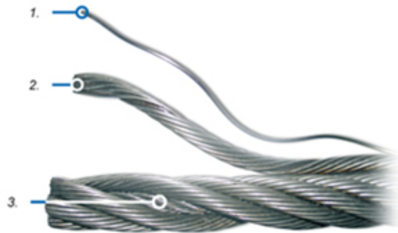
Figura 2: 1. Alambre 2. Torón 3. Cable

La posibilidad de fabricar alambres alargando barras industrialmente, propició la elaboración de cables. Un cable 14 es la reunión de varios torones, 15 diseñado especialmente para obtener una mayor resistencia a las deformaciones por tracción. Ellos forman un todo, es decir, un componente constructivo complejo con tecnología incorporada. Los mismos pueden agruparse en capas de forma plana alrededor de un alambre central o enrollados helicoidalmente formando cables espirales. Estos últimos ofrecen una resistencia mayor debido a la energía acumulada por la torsión de los alambres.