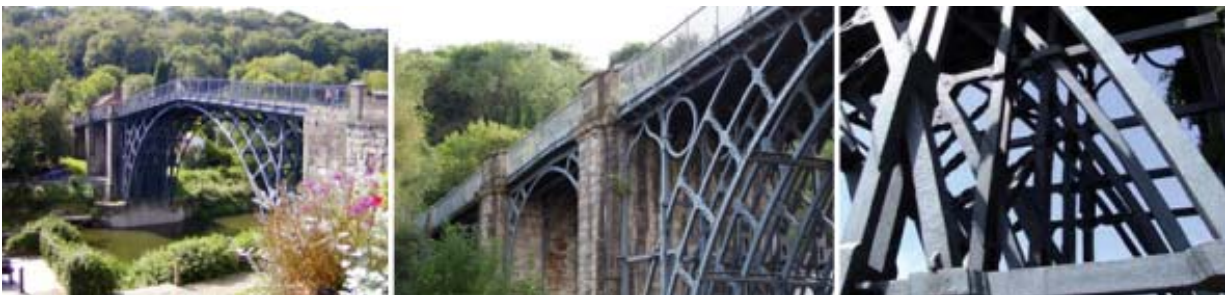
Figura 1: El Iron Bridge de sir Abraham Darby III. Río Severn. Inglaterra, 1779.

Si bien el Iron Bridge no es un puente colgante, es un hito clave en este rastreo de cursos de acción, ya que es considerado el primer puente en el cual el hierro fundido fue utilizado estructuralmente, “el primer uso del metal para una estructura” (McCormac, 2009). El Iron Bridge sobre el río Severn en Inglaterra, llamado también el puente de arco de Coalbrookdale (Figura 1), es la materialización de una nueva traducción. Su forma en arco obedece aun a la lógica estructural y constructiva de los puentes de piedra, y a la vez revela las aún limitadas propiedades mecánicas del hierro fundido para ser sometido a esfuerzos de tracción y a su gran versatilidad para ser moldeado. La existencia de una familia con tradición en fundición de hierro y capacidad productiva permitió el desarrollo de una nueva forma de fundir acero a base de coque, que representó un avance importante en la técnica utilizada hasta el momento. 9