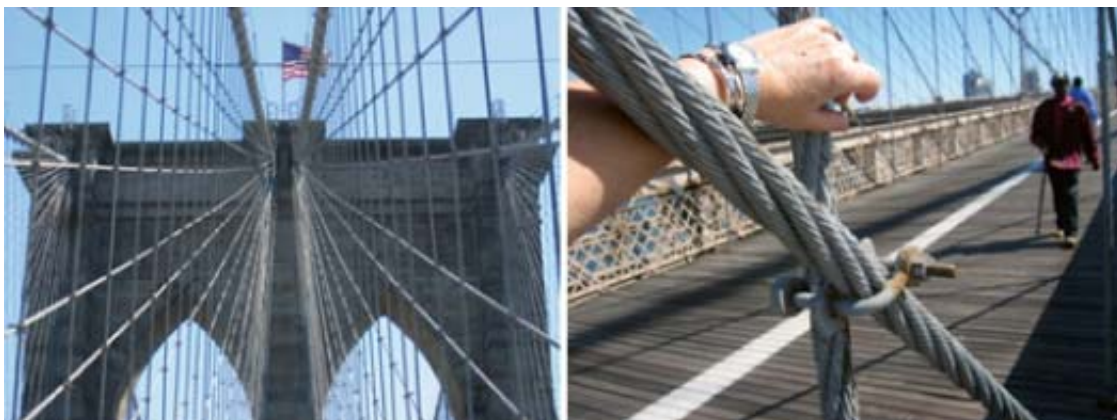
Figura 4: Vista del puente de Brooklyn de Roebling, Nueva York, Estados Unidos. Detalle de los cables con escala humana.

Fue en Estados Unidos donde se construyó el primer puente colgante moderno del mundo, el de Brooklyn (Figura 4). Su autor, uno de los primeros inmigrantes alemanes, John Roebling (1806-1869), había realizado un poco antes uno de los aportes más importantes a la técnica de colgar puentes, su patente del cable de alambre de 1842. “Los cables de Roebling