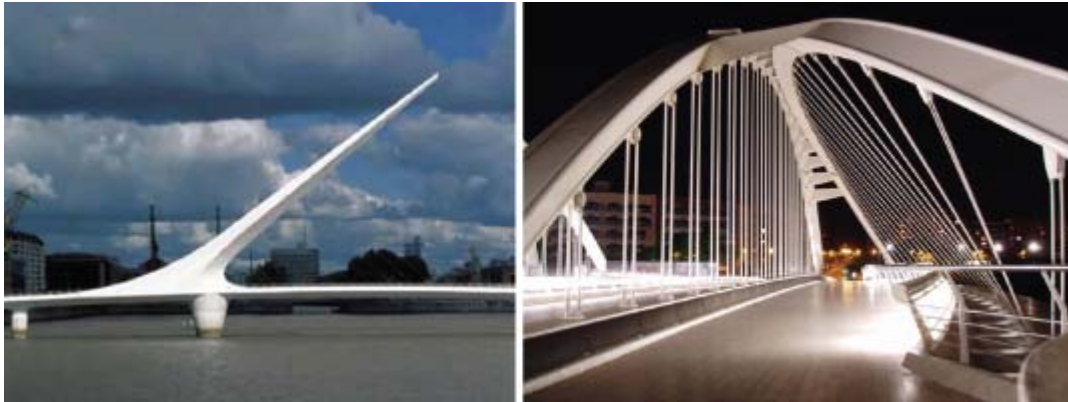
Figura 5: Puentes de Alamillo y Lusitania, de Santiago Calatrava

Los puentes de Calatrava utilizan no solo las más sofisticadas aleaciones de acero, que le conceden a los miembros estructurales resistencia, a la vez que ligereza, sino que además integran el manejo de la forma y el equilibrio con los conceptos más innovadores de sismorresistencia, a base de amortiguadores, tirantes, rigidizadores, sistemas computarizados, nodos inteligentes y contrapesos. Sus obras son excelentes ejemplos de nuevas asociaciones y dejan abiertos cursos de acción retadores para las próximas generaciones.