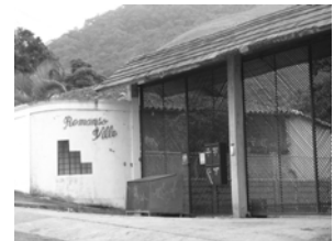
Foto 06. Urb. Remanso Ville