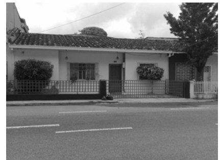
Foto 02. Barrio Militar.