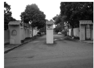
Foto 05. Urb. La Blanca