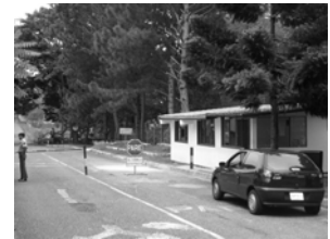
Foto 04. Urb. Militar