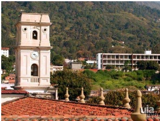
Foto N° 1 Torre del reloj del Rectorado de la ULA. Elemento fundamental del perfil urbano ciudadano

Las edificaciones universitarias educativas, representativas y de administración, conforman parte mayoritaria del grupo de la arquitectura más rica de la ciudad, y por tanto de la imagen colectiva que se obtiene de la misma, consolidando sectores de calificación urbana. Sus núcleos en Mérida han impulsado la incorporación de sectores no desarrollados al tejido y la vida urbana.