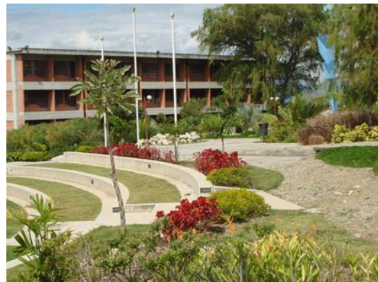
Foto N° 2 Plaza de la Facultad de Ciencias Económicas y Sociales- ULA. Buen ejemplo de paisajismo urbano

El estudiante ulandino conforma una población que proviene de diferentes lugares del país, habiendo alumnos de otros países que mayoritariamente cursan estudios de postgrado. Ellos portan diversos hábitos y costumbres que le imprimen a la ciudad una diversidad cultural que funciona sobre la base de una expresión local profunda. Por ello en Mérida conviven armoniosamente expresiones heterogéneas de carácter cultural, social y espacial.